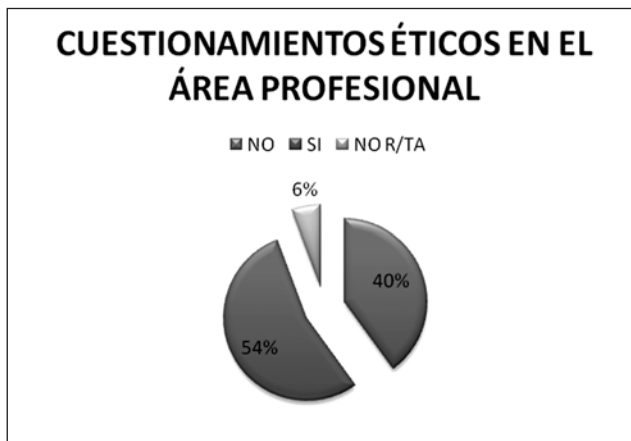
Figura 3. Cuestionamientos éticos en el área profesional

A partir de los hallazgos cualitativos, se menciona repetitivamente que el origen de los cuestionamientos de los profesionales se puede agrupar en cuatro grupos principalmente como son: